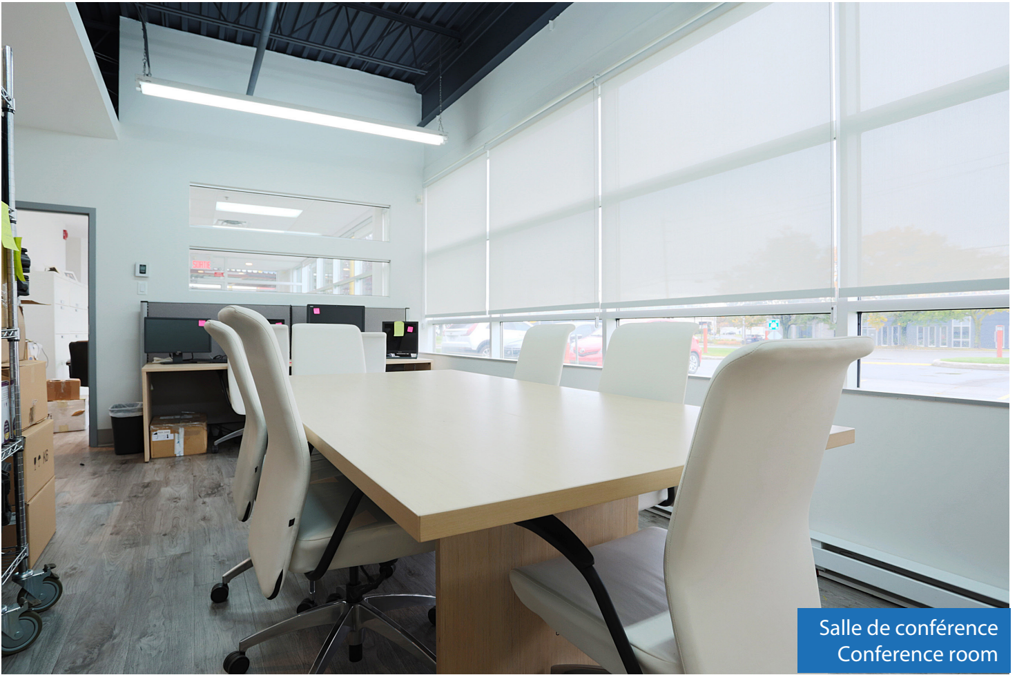
Salle de conférence Conference room