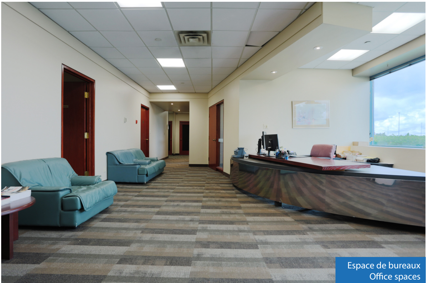
Espace de bureaux Office spaces