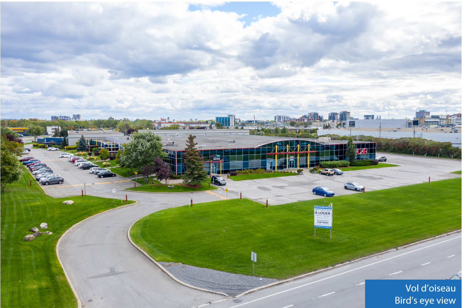
Vol d'oiseau Bird's eye view