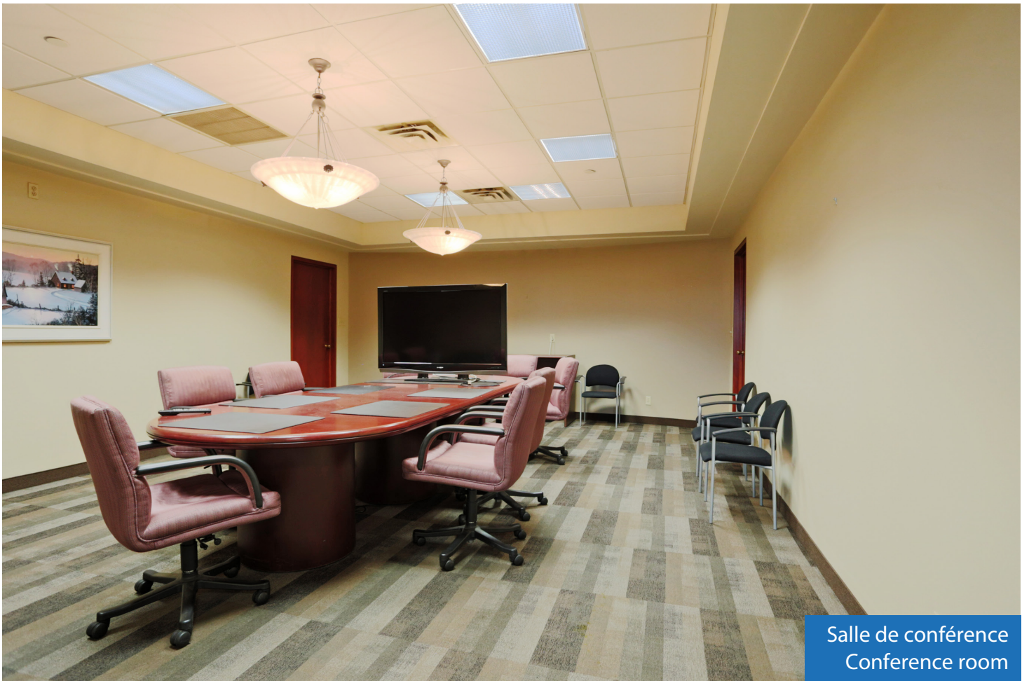
Salle de conférence Conference room